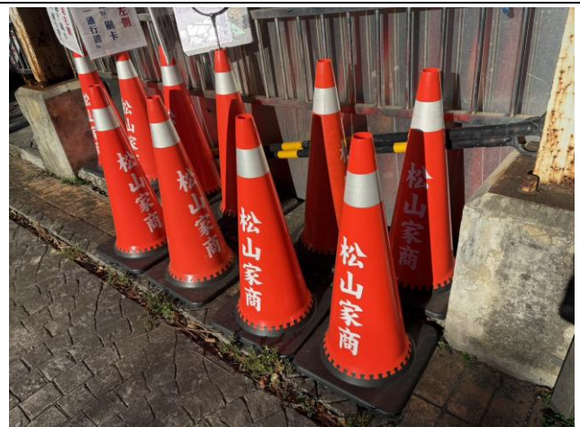
三角錐 5 個