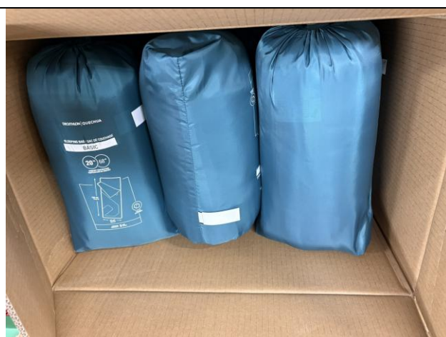
睡袋 10 個