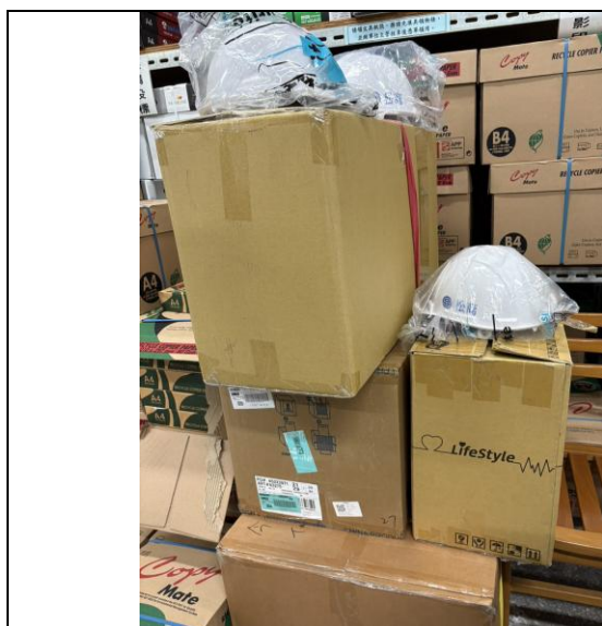
安全帽 100 個