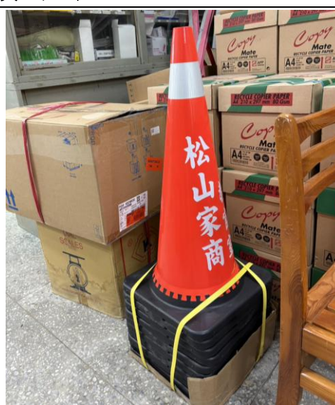
三角錐 10 個