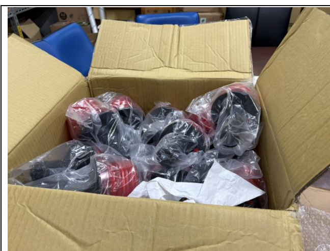
太陽能間警示燈 20 個