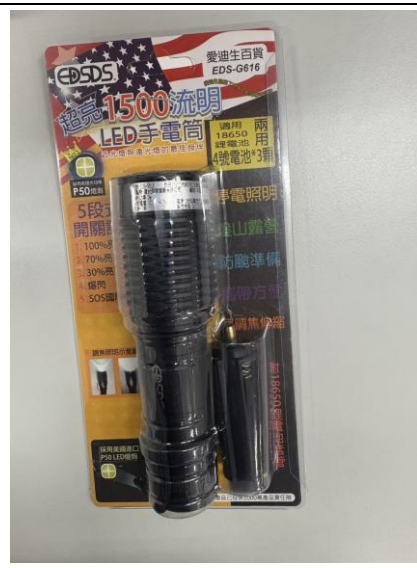
LED 充電式手電筒 1 個