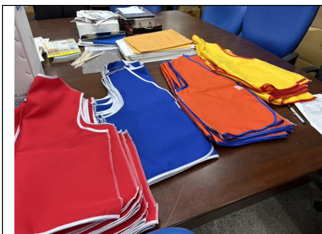
防災背心 20 件