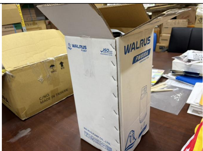
抽水機 1 個