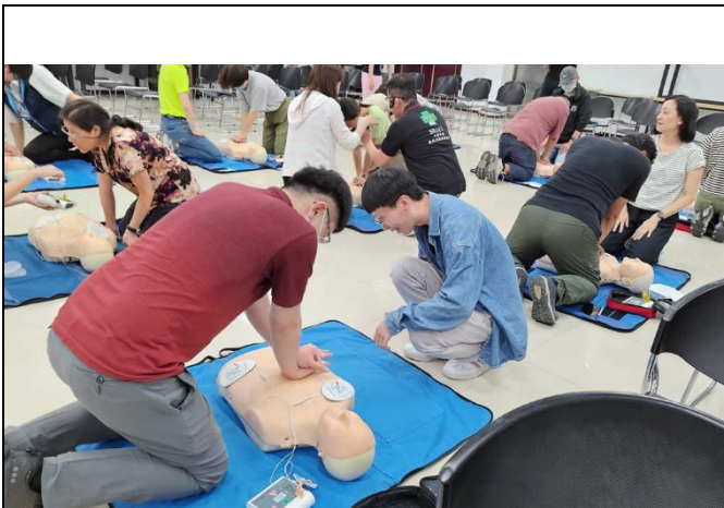
觀摩練習胸部按壓技巧