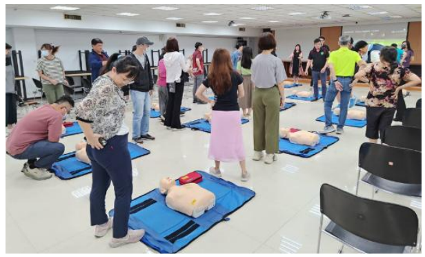
學員兩人一組進行CPR與AED操作練習