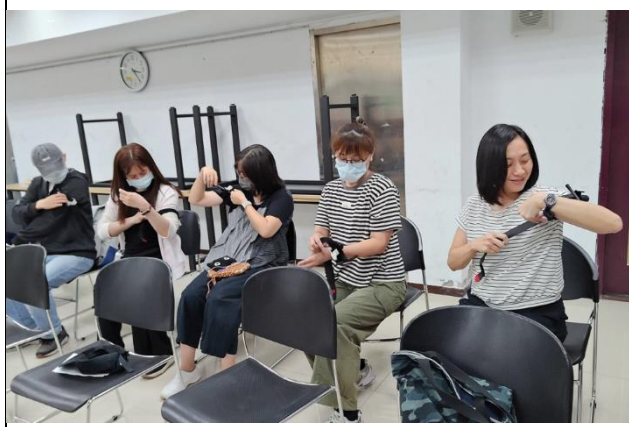
進行止血帶的操作練習