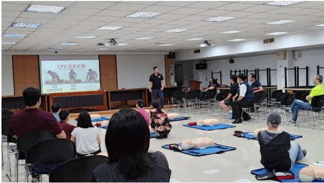
講師講解急救步驟