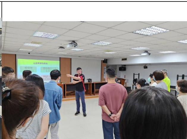
講師解說止血帶的使用方法