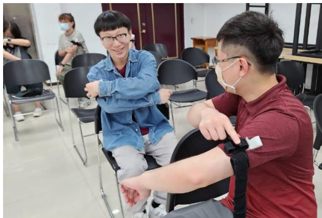
進行止血帶的操作練習