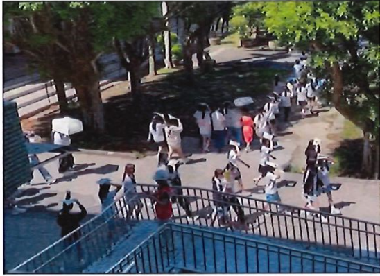
地震減緩後學生掩護頭部疏散前往操場集合