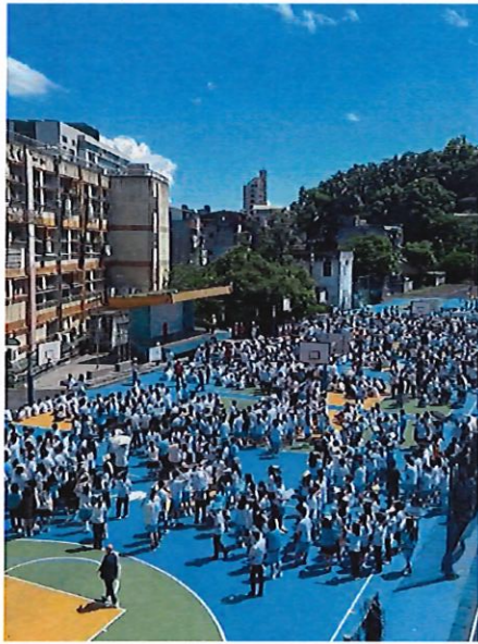
學生疏散至操場集合