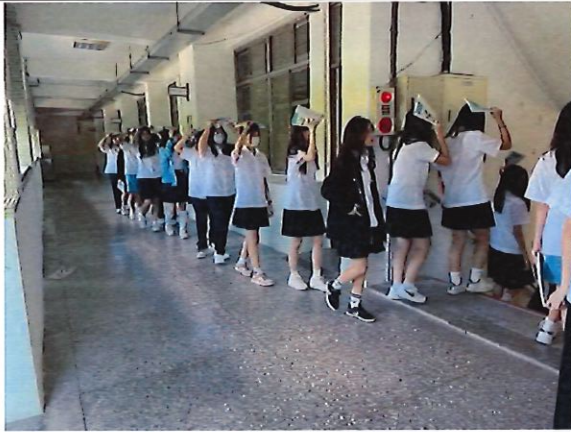
學生遵守「不語、不跑、不推」原則