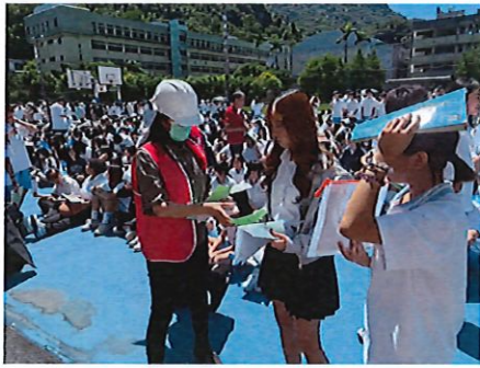
學生疏散集合並清點人數