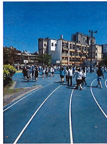
學生疏散前往操場集合