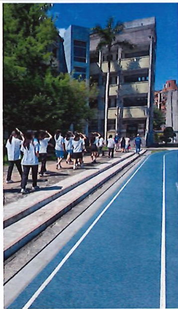
學生疏散前往操場集合