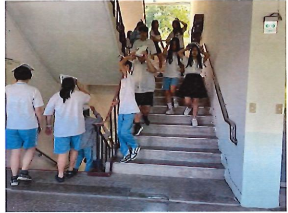
學生遵守「不語、不跑、不推」原則