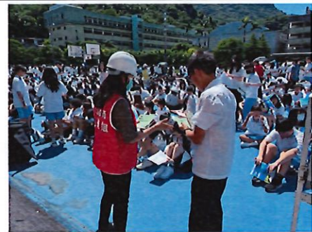
學生疏散集合並清點人數