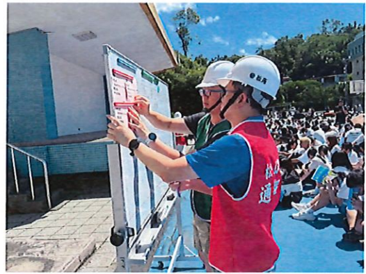
學生疏散集合並清點人數