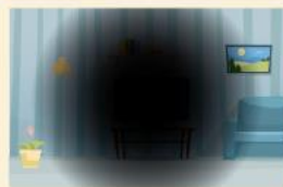
黃斑部病變 中心視野受損