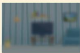
白內障 視力模糊、昏暗