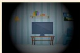
青光眼 邊緣視野受損