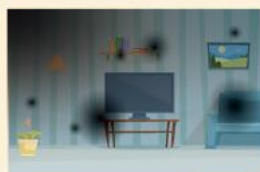
視網膜剝離 視野缺損