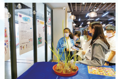
學生熱烈地參觀，填寫學習單。