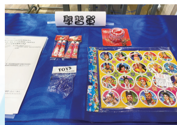
學生能夠看到實體的童玩，感受當年的玩具