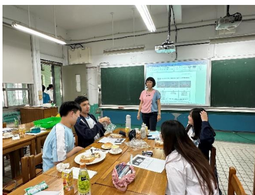
西餐禮儀、門市服務禮儀