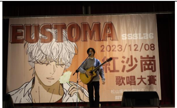
紅沙崗歌唱大賽活動剪影-2