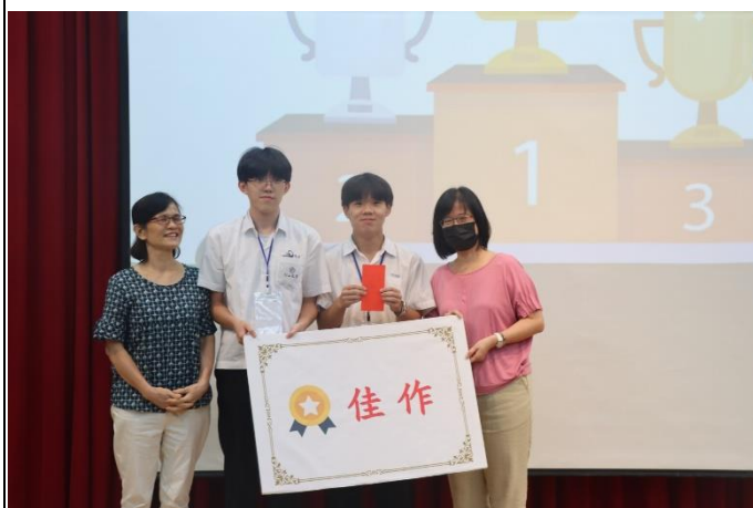
優勝-佳作，並發獎金