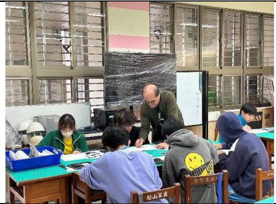
基礎描繪的工具(二)