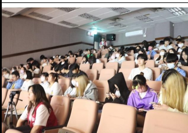
一二年級全體學生觀摩