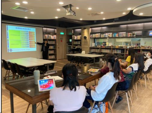
素養導向－深化教師專業研習 1