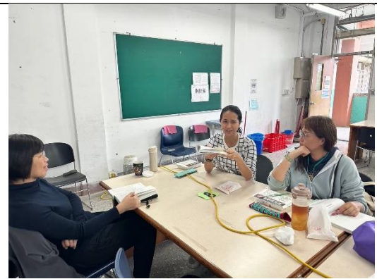
跨域社群共備課程 1