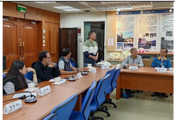
素養導向－深化教師專業研習 4