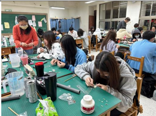
講師帶領學生模型製作 01