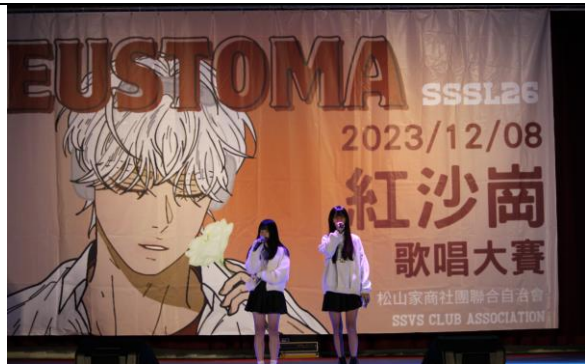
紅沙崗歌唱大賽活動剪影-1