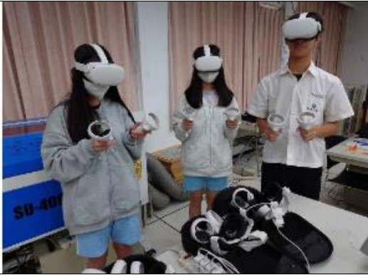
數位學習-虛擬實境 1