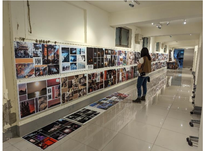
科展開幕暨頒獎典禮：