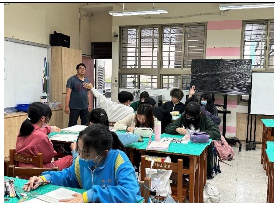
光影明暗的觀察與表現