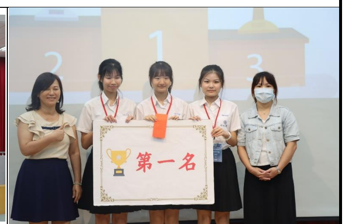
指導老師、決賽選手、工作人員大合影 優勝-第一名，並發獎金