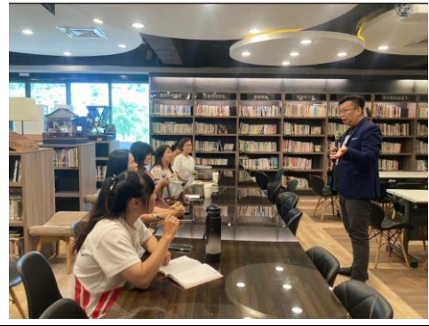
素養導向－深化教師專業研習 2