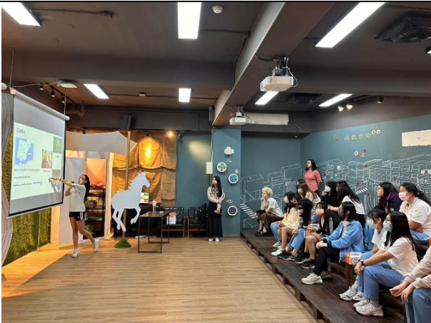
國際交換生文化交流 3