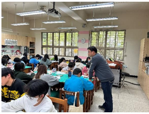
基礎描繪的工具(一)