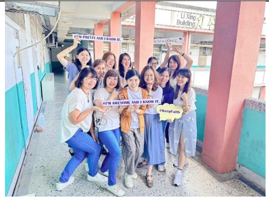
閱思歷李跨域教師合影