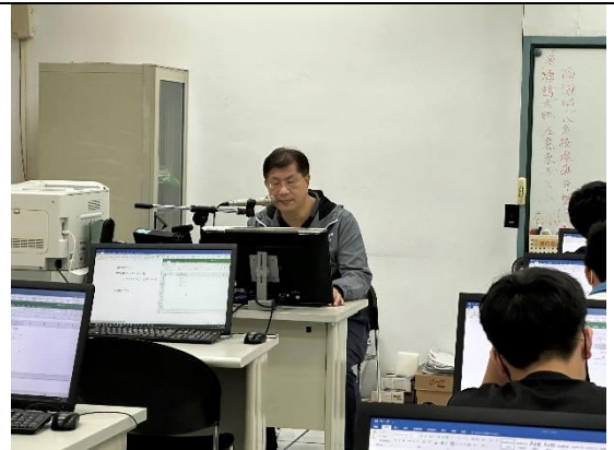
響應式網頁規劃設計(二)