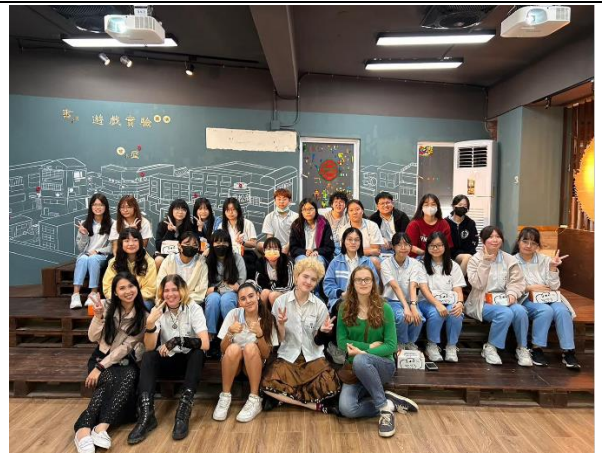
國際交換生文化交流 4