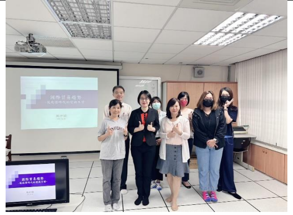
專題講座 4_與講師一起合影