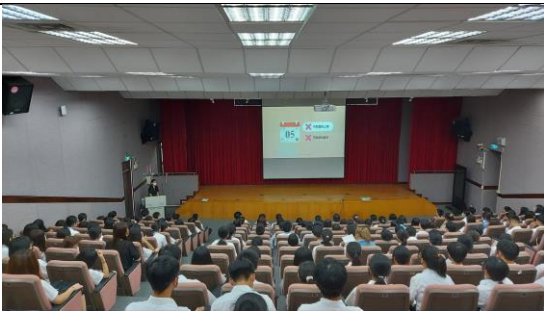
學習歷程檔案講座 1