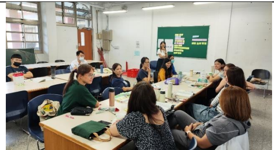
跨域社群共備課程 4