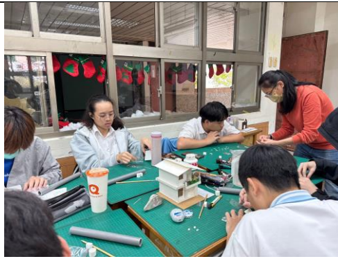
講師帶領學生實作