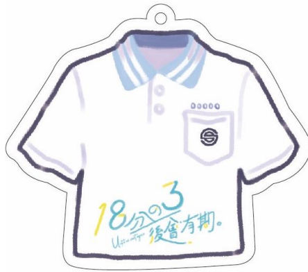
文創商品-手機吊飾