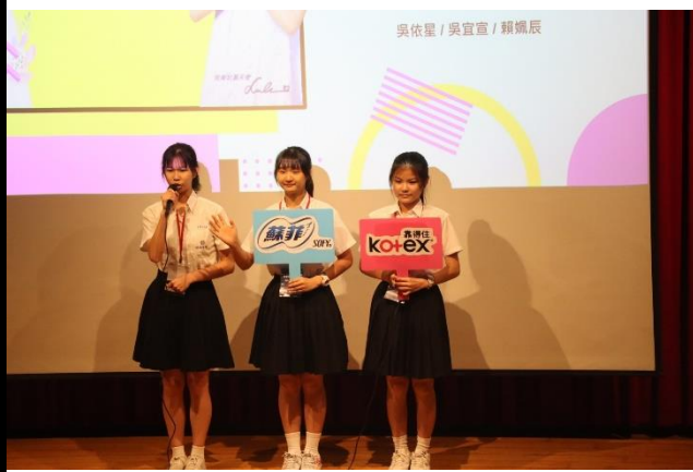
分組上台口頭報告競賽