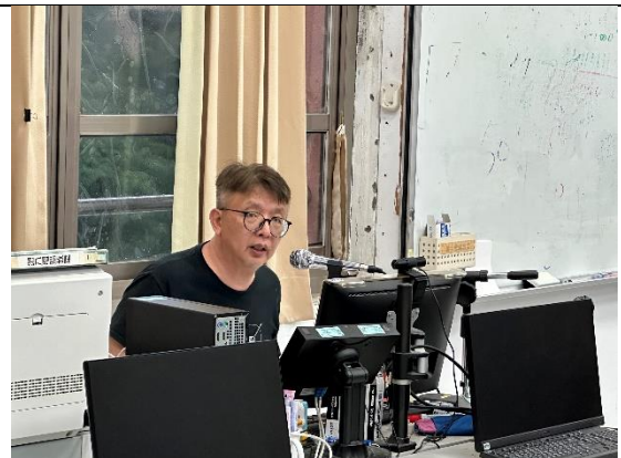
文創商品設計與行銷