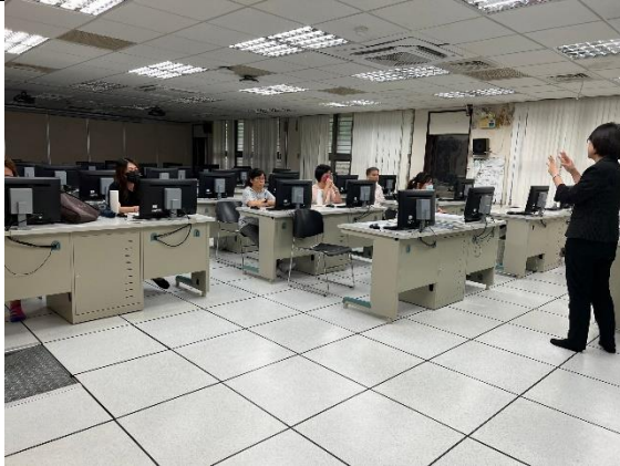
專題講座 3_全體國貿教師餘第 12 電研習雲端貿易軟體個案演練