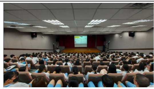
學習歷程檔案講座 2