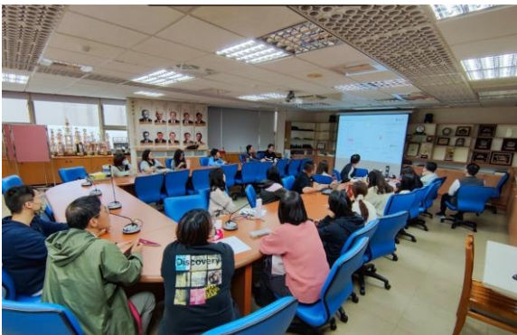
素養導向－深化教師專業研習 3