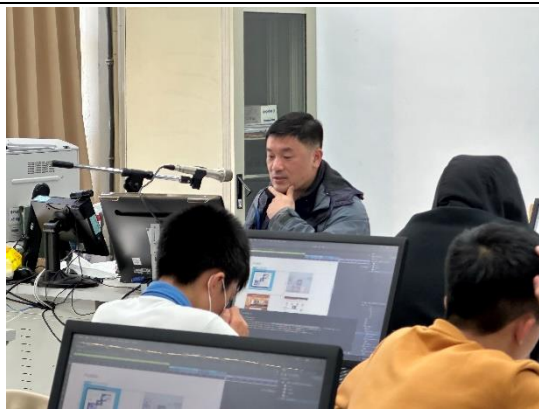
響應式網頁規劃設計(一)