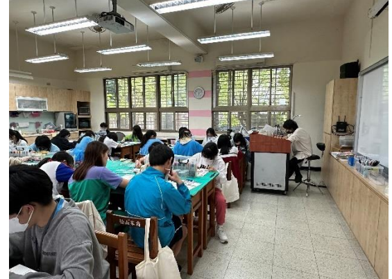
基礎描繪與素描概說