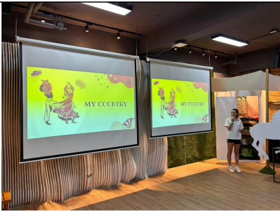
國際交換生文化交流 1