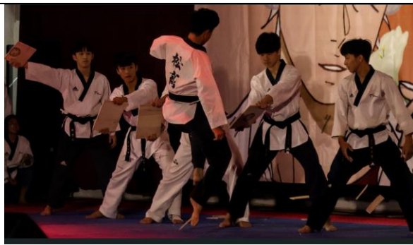
紅沙崗歌唱大賽活動剪影-3