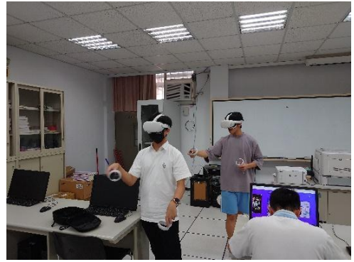
數位學習-虛擬實境 2