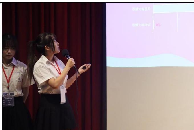
參賽學生簡報台風穩健