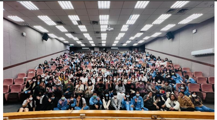
專題製作競賽佈置與評審：