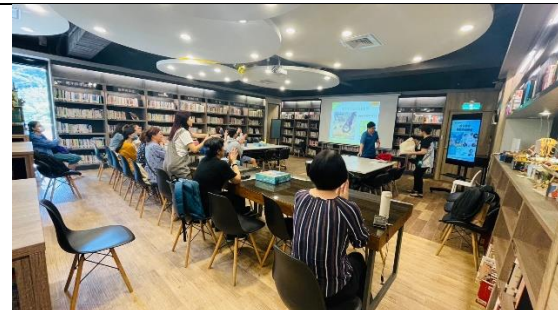
跨域社群共備課程 3