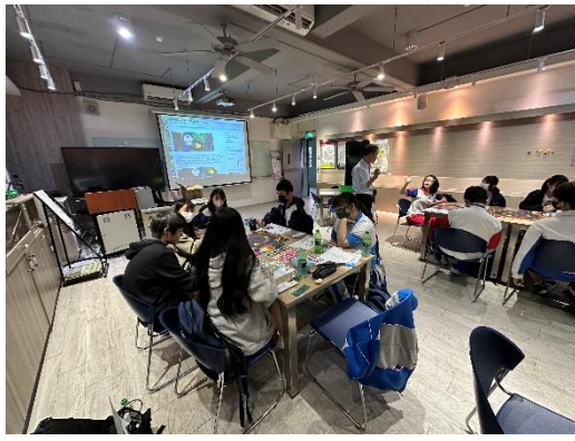
金融事件體驗活動