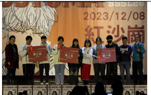
紅沙崗歌唱大賽活動剪影-4