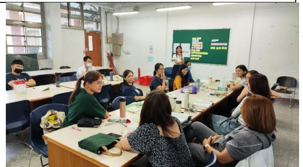
跨域社群共備課程 2