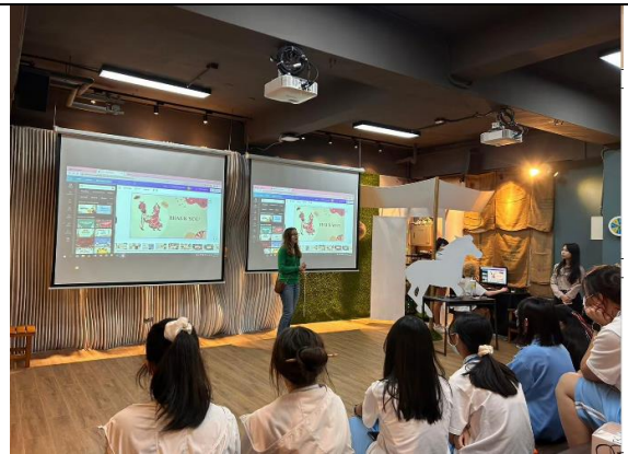
國際交換生文化交流 2