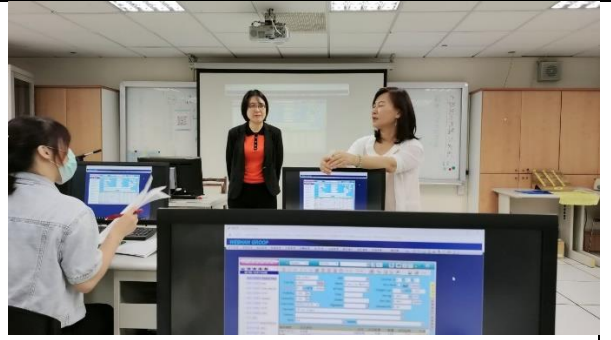
專題講座 2_講師分享 2024 國貿發展趨勢