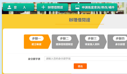
圖4：「國家公共資訊圖書館」平台登入成功後多項服務