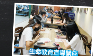
兒少保護週會宣導