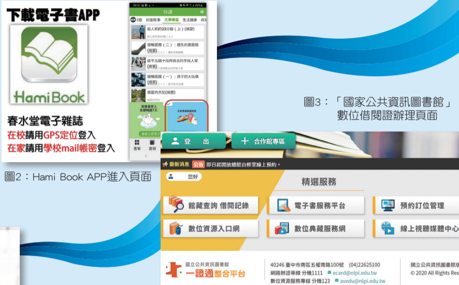
圖2：Hami Book APP進入頁面