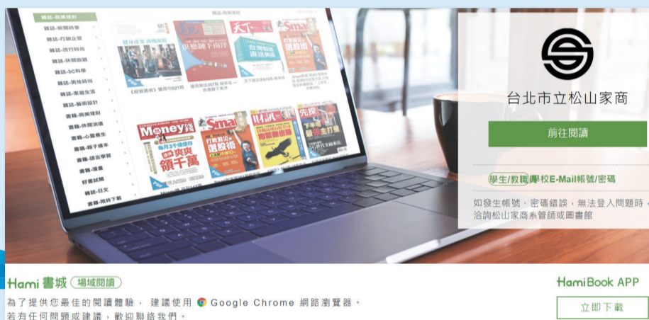
圖1：Hami Book松商圖書館專屬入口