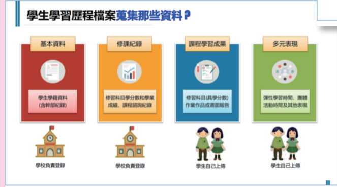
圖1：同學每學期需要上傳課程學習成果及多元表現